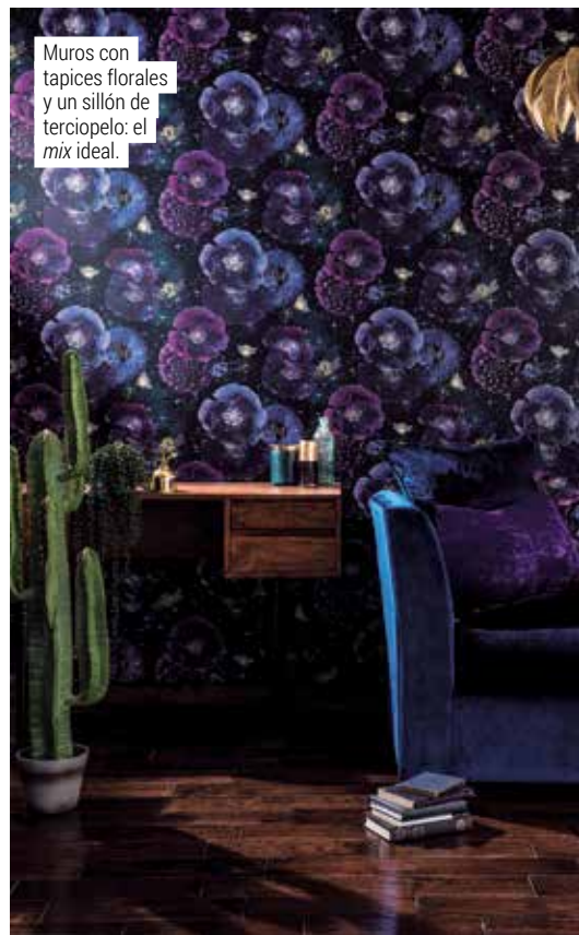
Muros con tapices florales y un sillón de terciopelo: el mix ideal.