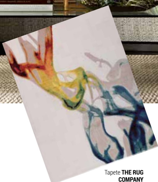
Tapete THE RUG COMPANY