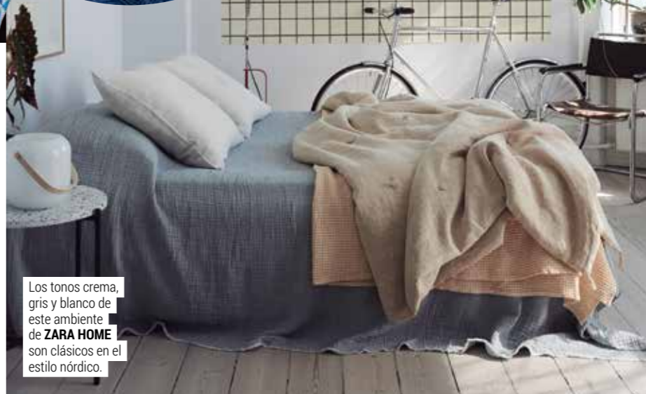
Los tonos crema, gris y blanco de este ambiente de ZARA HOME son clásicos en el estilo nórdico.

03. El gris en distintas tonalidades es un color neutro, ideal para todos los estilos. Presente en muebles, maderas, pisos y superficies.