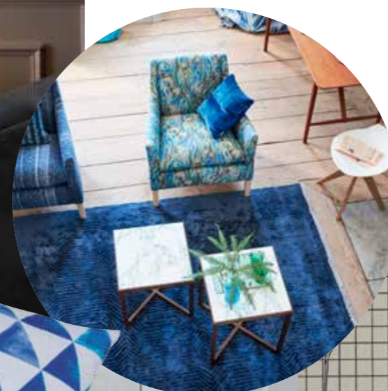
Alfombra Roxburgh Indigo DESIGNERS GUILD