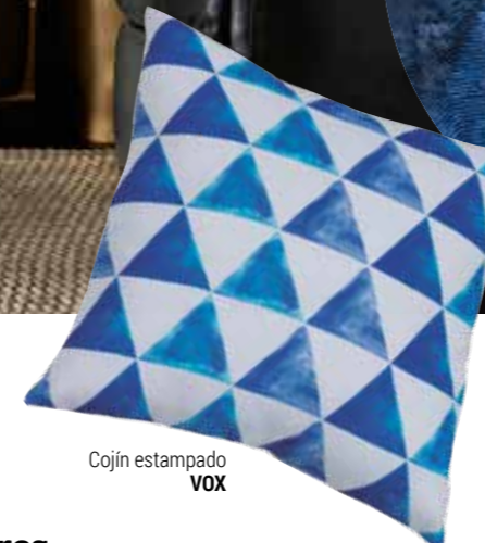
Cojín estampado VOX